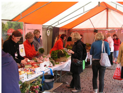
Lähirookatapahtuma Turun kauppatorilla 4.9.

Valtakunnallinen Lähirookaviesti polki sesonginmukaisten elintarvikkeiden puolesta syyskuun alussa. Viesti kaartoi myös Varsinais-Suomeen, Laitilaan, Mynämäelle, Raisioon sekä Turkuun. Viestin varrelle järjestettiin lähirookatoreja, tuotiin esille paikallista elintarvikeyritystä ja sen monimuotoisuutta, haastettiin päättäjät mukaan lähirookatalkoihin sekä viestittiin aktiivisesti paikalliselle medialle lähirookan mahdollisuuksista julkisissa elintarvikehankinnoissa.