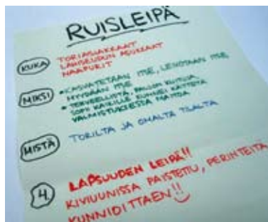
Ryhmätöiden tuloksina uusia elintarvikkeita