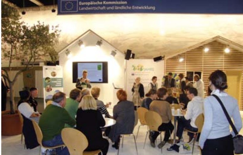
Varsinais-suomalainen lähiruoka esillä EU:n osastolla Grüne Woche -messuilla.

taan hulpeimmissa messuasetelmissä. LounaFoodin lisäksi EU:n verkostoyksikön kutsumana osastolla esittäytyivät pöytyäläiset elintarvikealan pienyrittäjät Makeidonin makeistehdas ja Riihipuodin mylly. Osastolla saimme erittäin ystävällisen ja tervetulleen vastaanoton. Makeidonin makeiset ja Riihipuodin ohrapuuro maistuivat hyvin messuyleisölle.