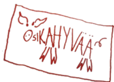
Sikahyvää sianlihaa -idea sai jo oman tuotemerkin