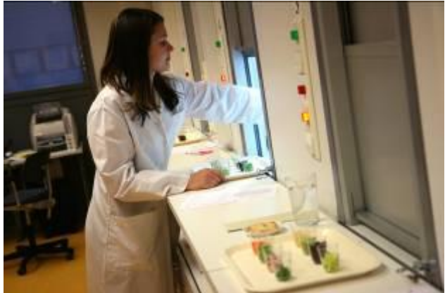
Kuva arvionnista

Tuotekehityksen suuntaamisen lisäksi tuloksista voidaan saada ideoita uusiin tuotteisiin. Meltovaaran mielestä Mieltymysprofiilia voidaan parhaiten hyödyntää olemassa olevan tuotevalikoiman analysoinnissa, kun voidaan verrata omia tuotteita markkinoilla oleviin kilpailijoiden tuotteisiin. Huonosti myyvän tuotteen kohdalla saadaan selville, miten tuote mahdollisesti eroaa markkinoilla menestyvistä tuotteista. Tulosten perusteella voidaan myös havaita tarve kehittää olemassa olevan hyvin myyvän tuotteen rinnalle keskivertokuluttajan mieltymysten mukainen tuote täydentämään valikoimaa.