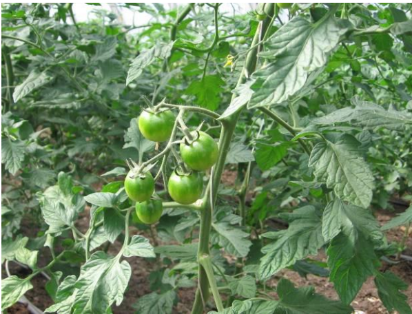
Mikolan luomutilan värikästä satoa.