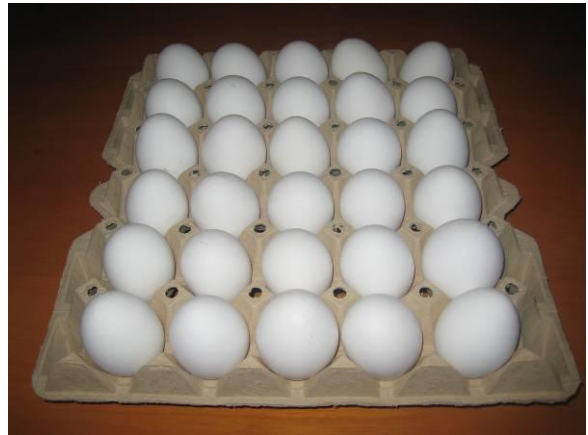
Omega-luomukananmunat ovat sydänystävällisiä.

"Aina on kehitettävää", tuumivat Olla-Riitta ja Antti-Jussi yhteen ääneen. "Tällä hetkellä kanoja on noin 4 000 kpl, mutta ensi syksynä aloitettavan vanhan kanalan laajenuksen myötä kanojen määrä nousee 7 500." Tuotantomäärä on reilu 20 000 kananmunaa viikossa. Kananmunat pakataan Laitilassa, josta niiden levikki keskusliikkeiden kautta on koko Suomi. Vielä ei omega luomukananmunia markkinoilta löydy, mutta tuotantopuoli on jo kunnossa. Kanoille syötetään rehun mukana pellavaa, jossa on hyvä rasvahappokoostumus. Pellavansiemenöljyssä on 60 % alfalinoleenihappoa sekä 20 % linolihappoa. Tämä terveydelle edullinen rasvahappokoostumus siirtyy myös kananmuniin. Aarikan omega luomukananmunat on tutkittu MTT:ssa.